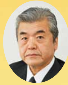
長正 会英 会工 石丸 商工

小暑の候、会員の皆様には益々ご清祥のこととお慶び申し上げます。また、日頃は本商工会運営にご理解とご協力を賜わり厚く御礼申し上げます。