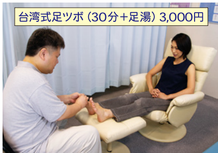
台湾式足ツボ (30分+足湯) 3,000円

本場台湾で足ツボマッサージの資格(足健員)を取得した院長による施術を行っております。健康は足裏から。お試しクーポンは動画の最後です。この機会にご体験ください。