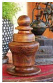
キャディストッカー

淹れ立てのコーヒーを飲んでいただけるよう、ドリップパックも用意しました。パッケージの大正レトロなパッケージは、アクセサリー作家である妻がデザインしています。