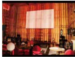
店舗内観(シアター)

当店は、築80年になる土蔵作りの米蔵をリノベーションし、平成27年にオープンしました。オールデコ調の家具やステンドグラスのインテリアを配したノスタルジックな空間です。メニューには極力、香川県産の食材を使い、ひと手間かけた洋食を提供。私が漆を塗り直した大正時代のアンティーク漆器に料理を盛り付け、お客さまに漆器を触れていただく工夫