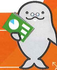
応援キャラクター すなめりー