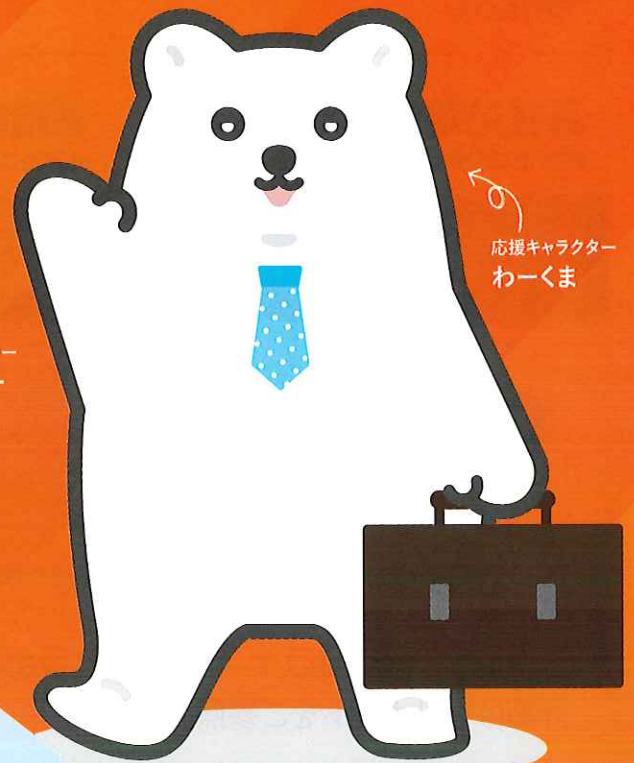
応援キャラクター わーくま

※本事業は、概ね35歳から55歳の方で、 “正社員就職を目指す方”、“就労その他の職業的自立を目指す方”、 ”就労に限らない多様な社会参加を目指す方”を支援することを 目的とする事業です。