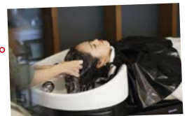
※写真はイメージです。