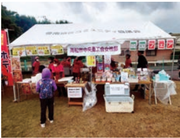
まちづくりフェスティバル・韓国フェア