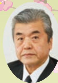
長正 会英 工丸 商石