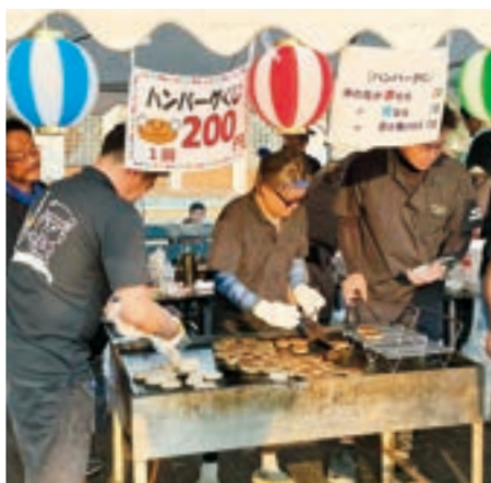
ボンフェスティバル in 香南