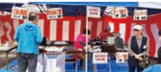
川島ふれあいまつり